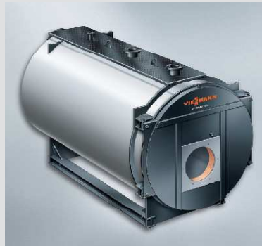
Vitomax 100-LW тип M148